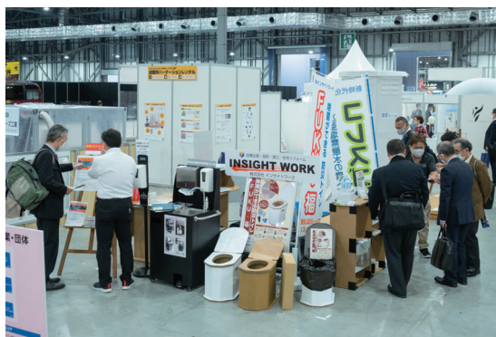
・前回実施した「避難所感染症対策エリア」の様子